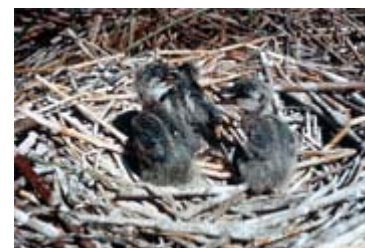
Ardea herodias

Au printemps, mâles et femelles arrivent à peu près en même temps aux sites de nidification, dès que les cours d'eau locaux ont dégelé, c'est-à-dire vers la fin de février dans l'Ouest du Canada et vers la fin de mars dans l'Est du pays. L'aire de nidification se trouve habituellement dans des terres boisées. Celles-ci sont situées à quelques kilomètres de l'aire principale d'alimentation de l'oiseau et sont relativement inaccessibles aux humains et aux prédateurs terrestres. Le mâle choisit l'emplacement du nid, la plupart du temps à un endroit où se trouvent déjà de vieux nids. Chaque mâle défend alors son territoire dans l'arbre où il compte construire un nouveau nid ou restaurer un nid existant. De là, il parade et pousse des cris stridents à l'approche des femelles. Les Hérons s'accouplent pour la première fois à l'âge de deux ans et ils changent de partenaire chaque année. Ils s'accouplent presque immédiatement à leur arrivée à l'aire de nidification.